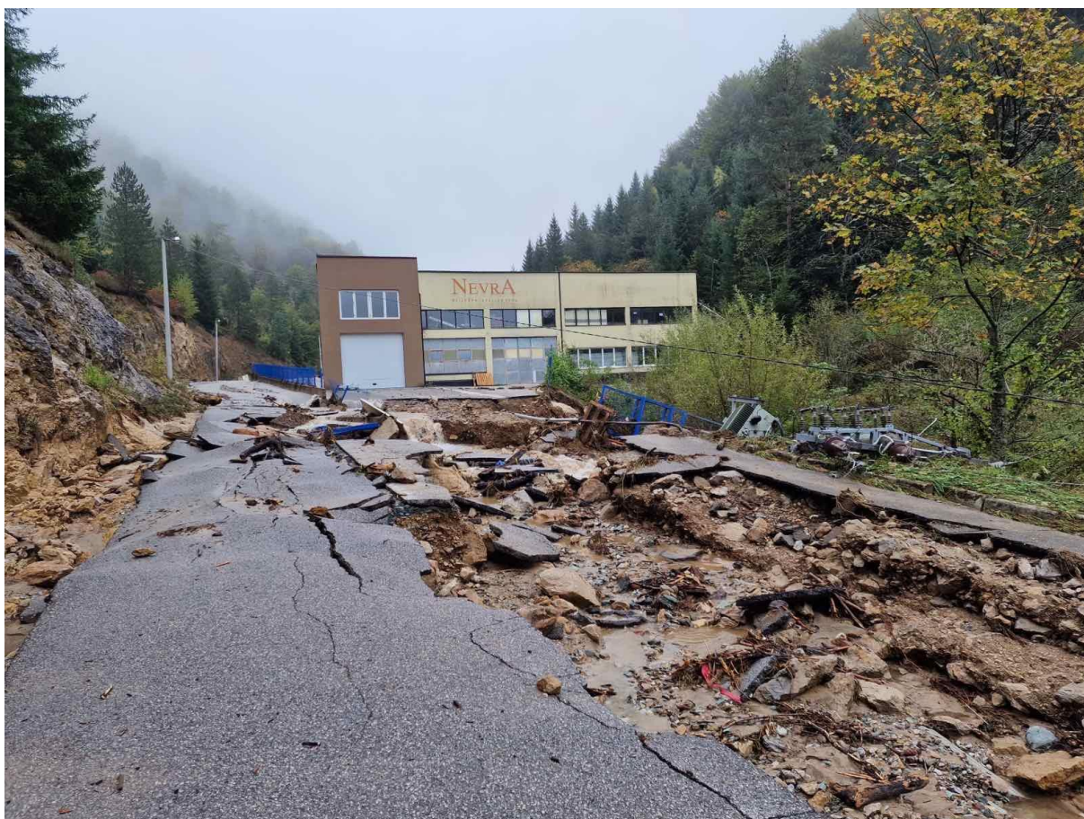
Slika 6. prikaz oštećenja lokalnog puta u selu Deževica, kao i kruga poslovnog objekta „Nevia“