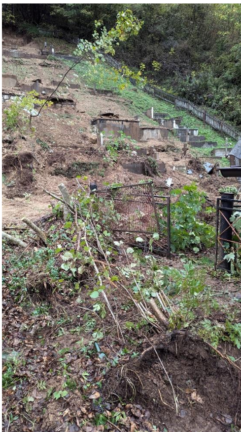
Slika 17. Klizište na groblju u mjestu Vranc