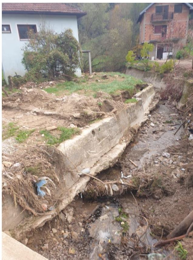
Slika 12. Prikaz uništenja korita potoka Rakovčica