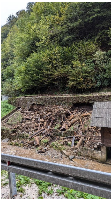
Slika 18. Oštećenje potpornog zida u mjestu Vranc