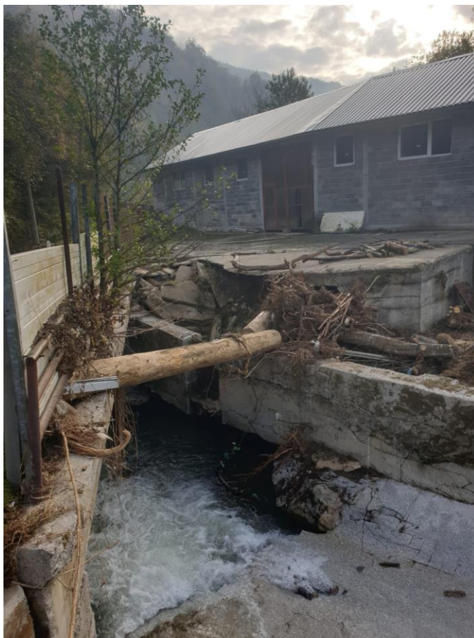
Slika 13. Uništenje korita Crne rijeke