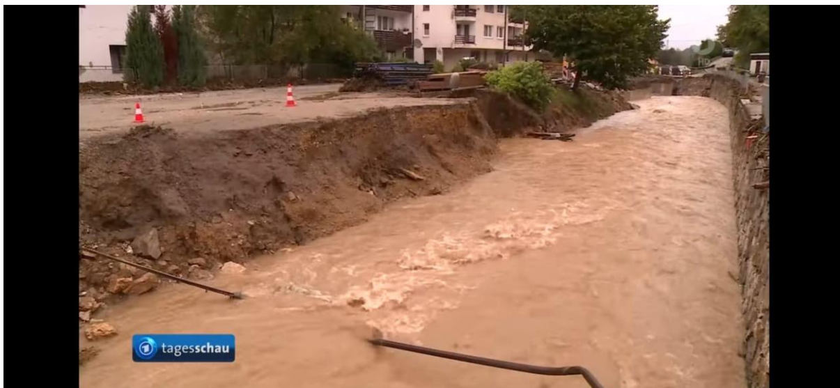
Slika 3. Prikaz oštećenja korita rijeke Kreševke