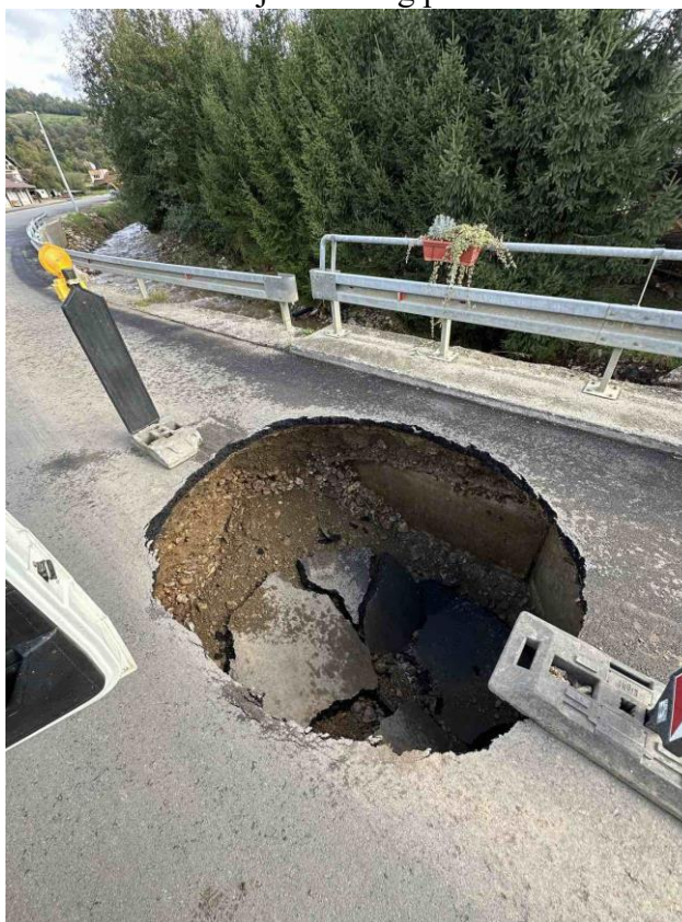
Slika 2. Prikaz oštećenja mosta na regionalnom putu R443