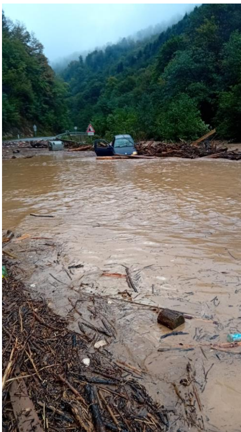
Slika 9. prikaz bujične poplave na regionalnom putu R443 – dionica Tomići