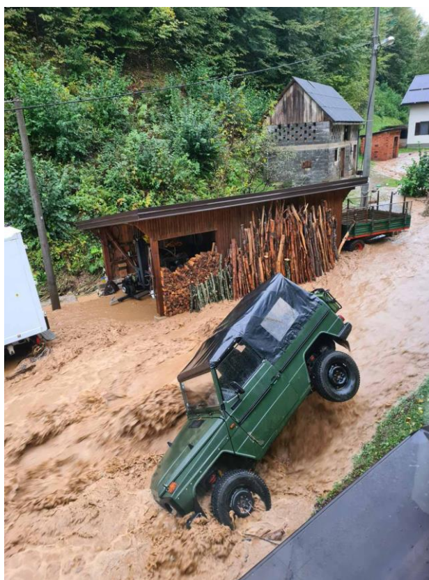
Slika 14. Bujična poplava Kojsinskog potoka