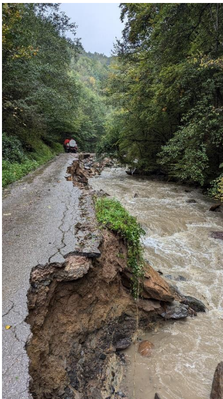
Slika 15. Uništenje lokalnog puta u mjestu Gunjani