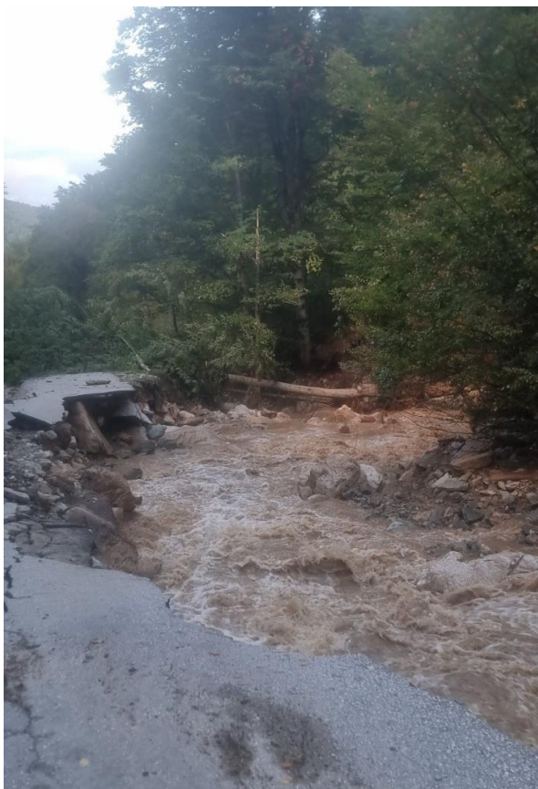
Slika 7. prikaz oštećenja lokalnog puta Dusina - Deževica