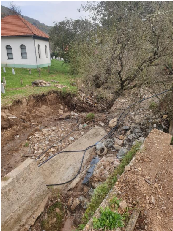
Slika 11. Odron zemljišta u mjestu Crnići