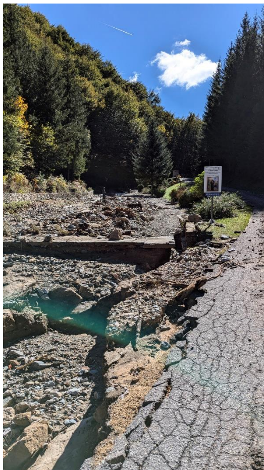
Slika 21. Prikaz štete na vrelu sv. Jakova