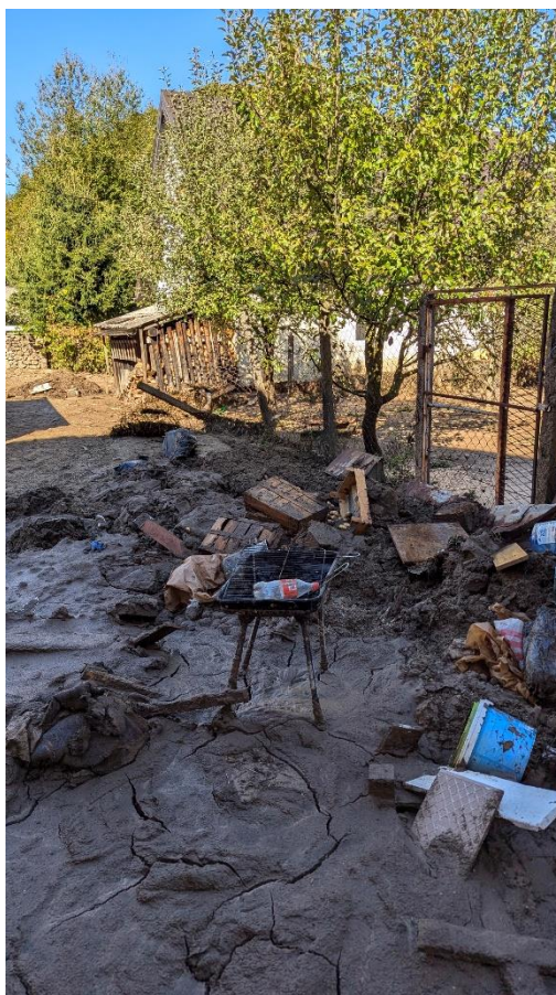
Slika 20. Prikaz primjera nanosa materijala uslijed poplava u privatnim dvorištima