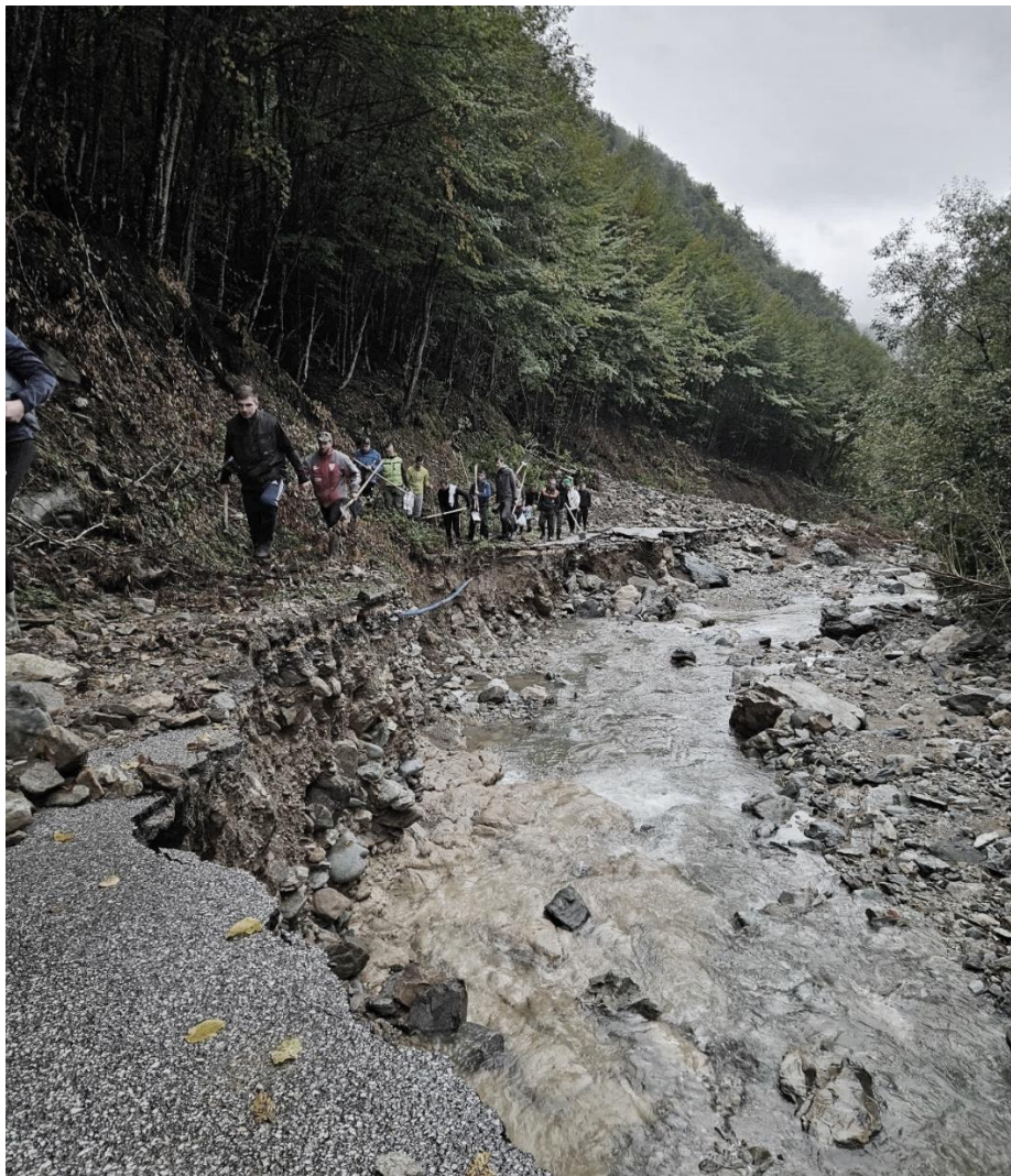
Kreševo, prosinac 2024. godine