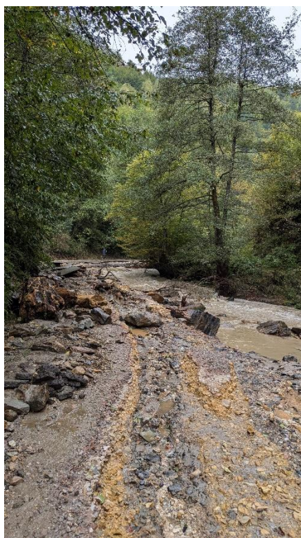
Slika 16. Uništenje lokalnog puta u mjestu Gunjani