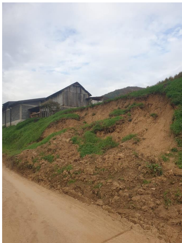
Slika 10. prikaz klizišta u mjestu Rakova Noga