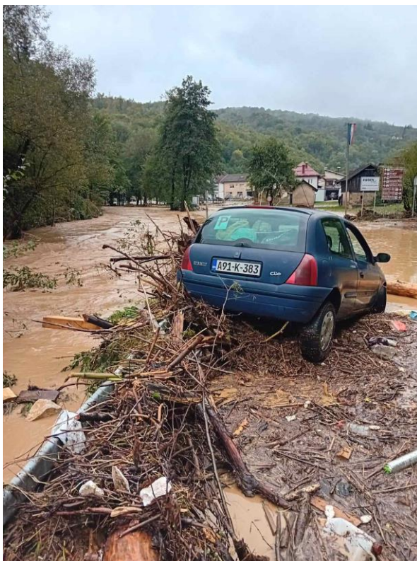
Slika 8. prikaz bujične poplave na regionalnom putu R443 – dionica Tomići