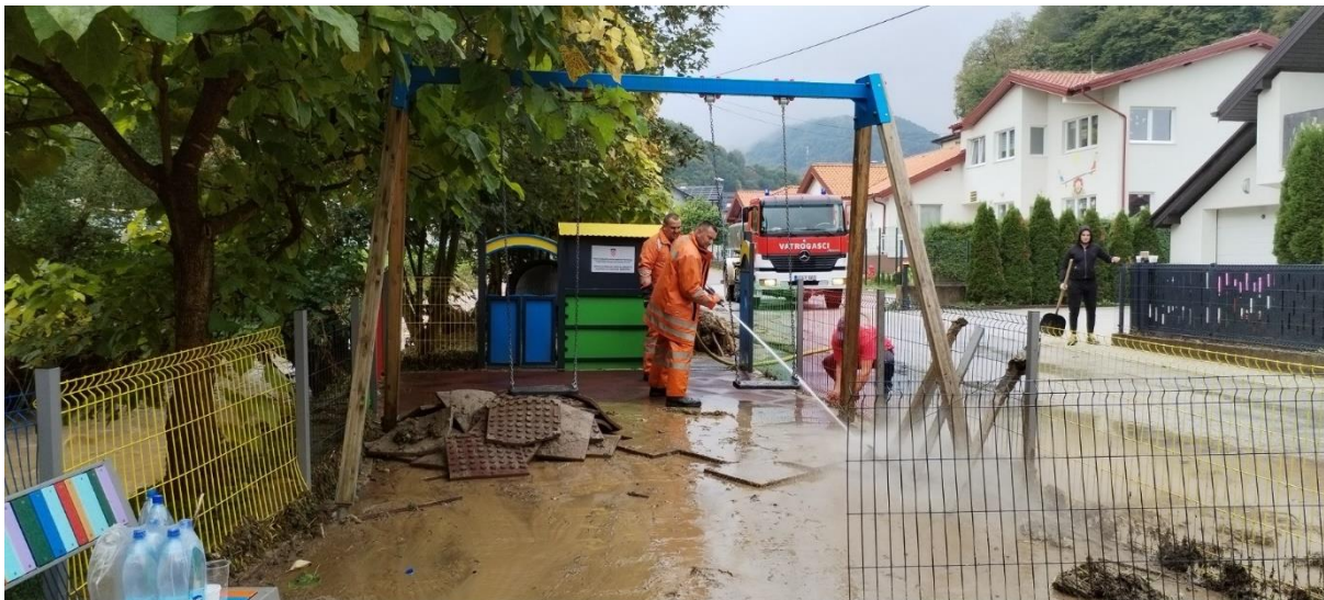
Slika 5. prikaz oštećenja dječjeg igrališta u mjestu Troska - Polje