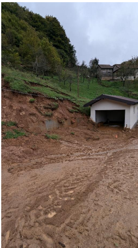
Slika 19. Klizište na privatnom posjedu u mjestu Kojšina