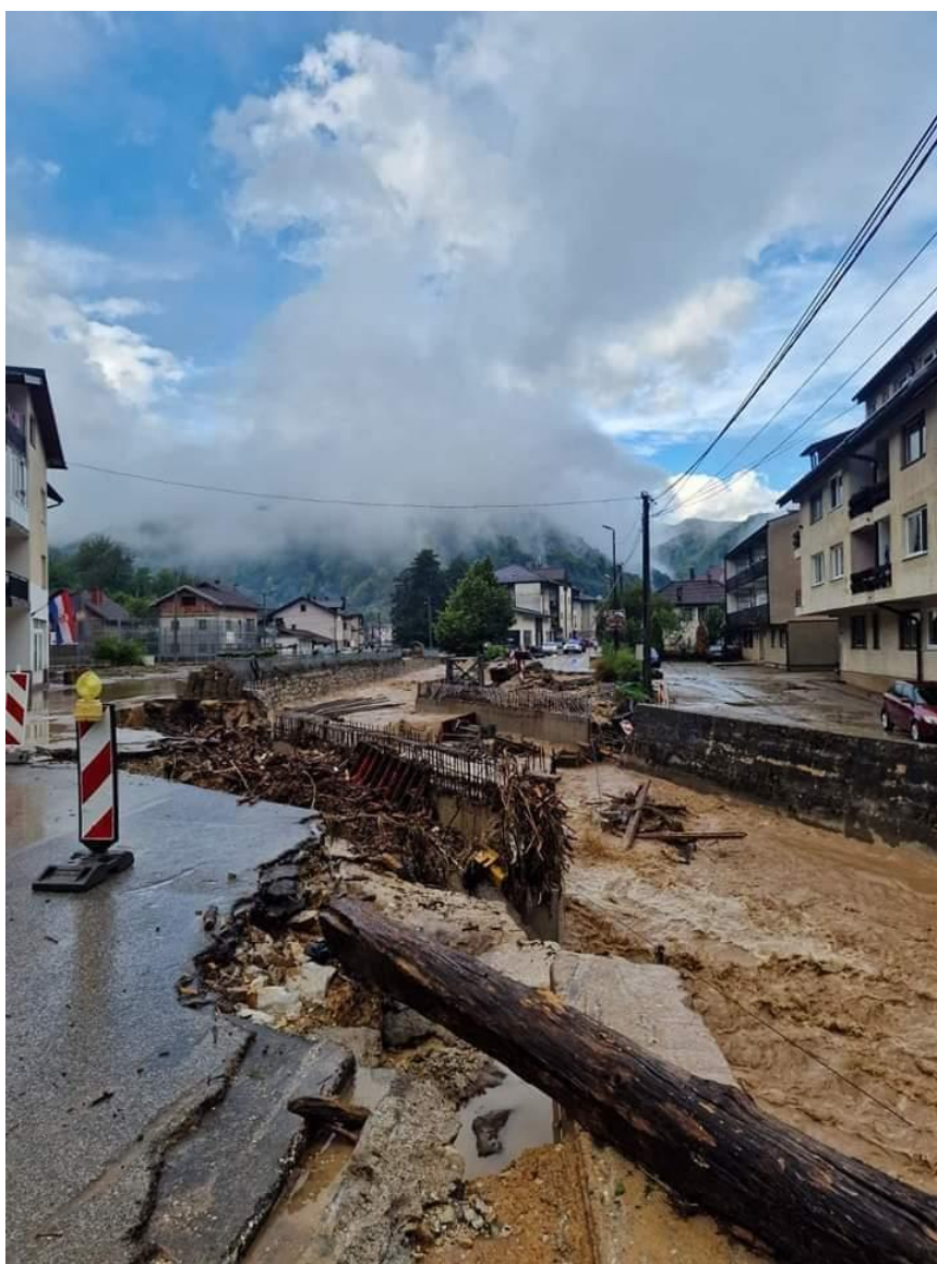
Slika 4. Prikaz oštećenja